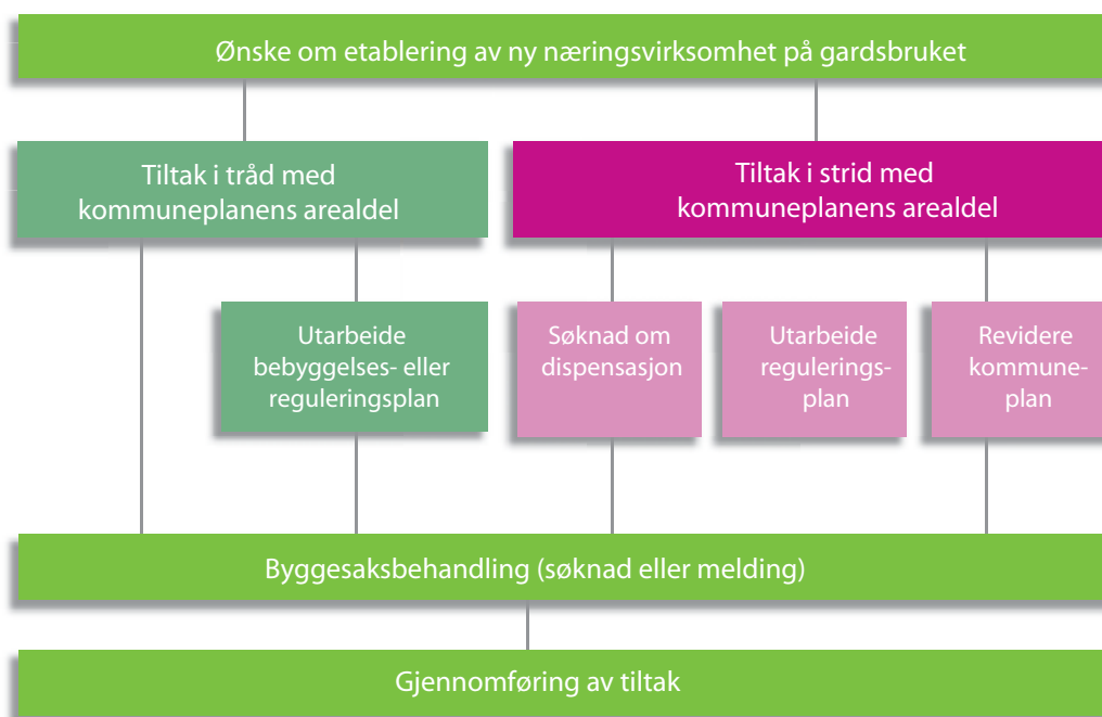
Fig. 1. Figuren viser hvordan tiltakets forhold til kommuneplanen avgjør saksgangen.