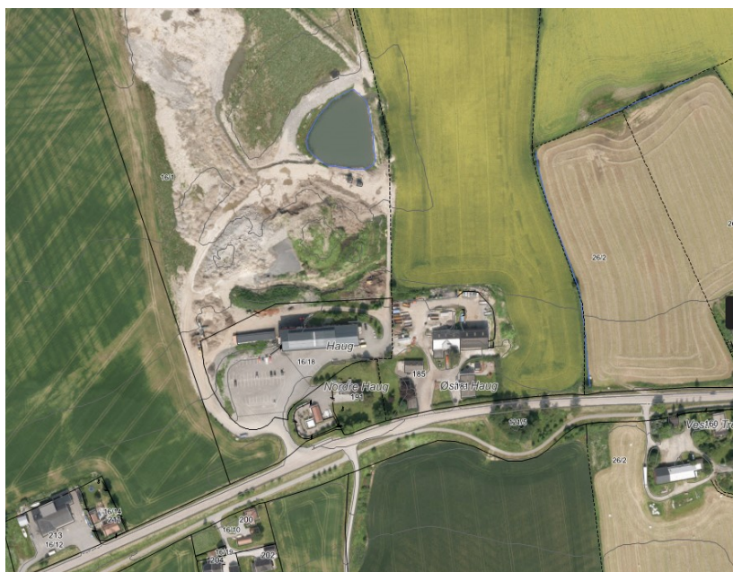
Ortofoto av planområdet

Formålet med planforslaget er å omregulere arealet og legge til rette for den driften som foregår på området i dag. I tillegg ønsker tiltakshaver å etablere saltlager m.m. innenfor planområdet.